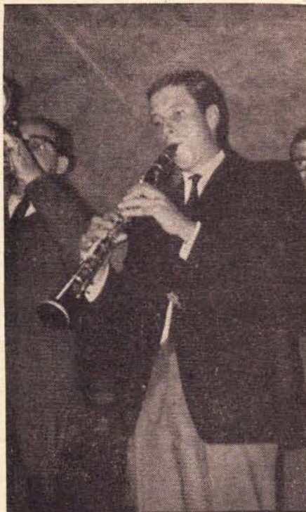
The Cotton Town Jazzband