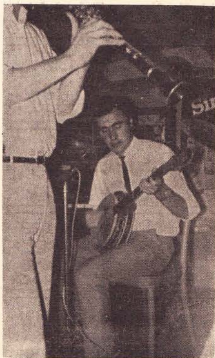
The Red Beans